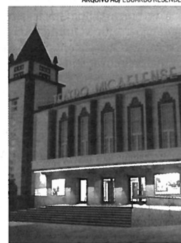
Teatro Micaelense recebe espetáculos a 10 de novembro

O Festival de Música dos Açores leva, este ano, espetáculos de música barroca e contemporânea a cinco ilhas do arquipélago, de 9 a 18 de novembro, anunciou ontem a associação cultural Jazzores.